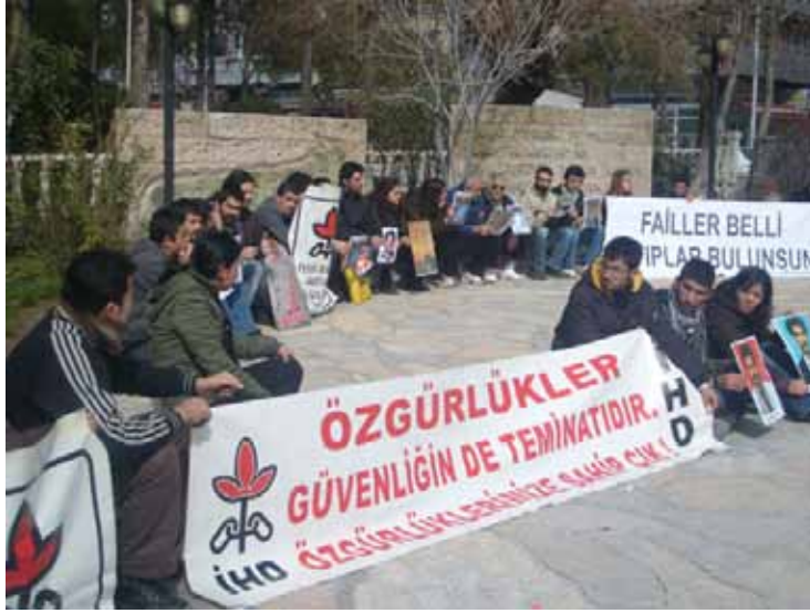
İHD Muğla Şubesi - "Kayıplar Eylemi" 18 Mayıs 2009