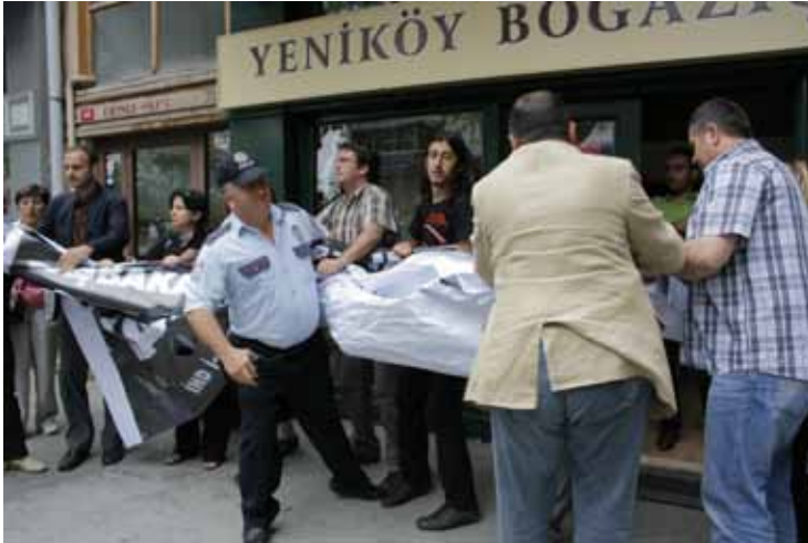
İHD İstanbul Şubesi - "Bir Daha Asla!" Eylemi / 24 Nisan 2010