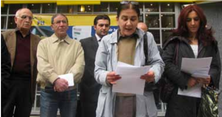
Cezaevlerine Mektup Gönderme Eylemi / 17 Nisan 2009