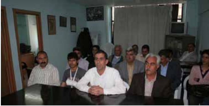
İHD Adana Şubesi Basın Açıklaması / 10 Nisan 2009