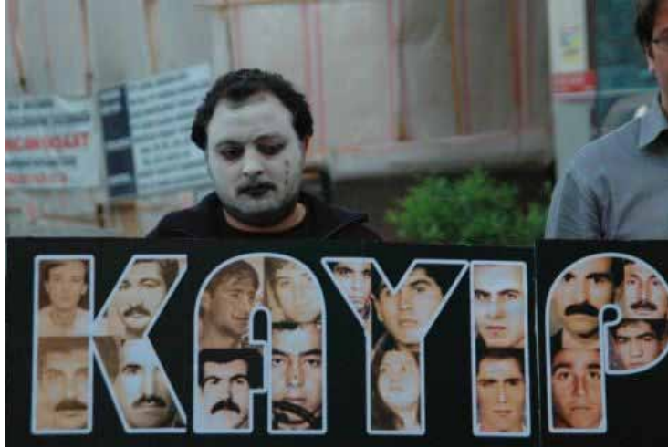
İHD İstanbul Şubesi ve Yaratıcı Direniş Atölyesi'nin "Kayıpları Arama" Eylemi / 27 Mayıs 2009