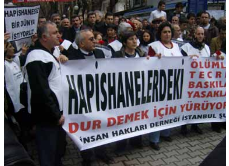
İstanbul'dan Ankara'ya Cezaevleri Yürüyüşü / 6 Şubat 2009