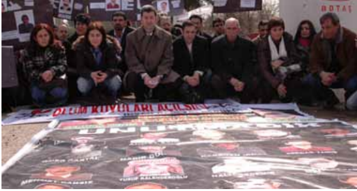
"Ölüm Kuyuları Açılsın" Eylemi / 23 Şubat 2009