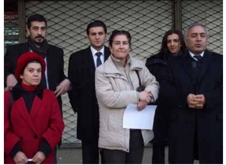
Cezaevlerine Mektup Gönderme Eylemi / 1 Ocak 2009