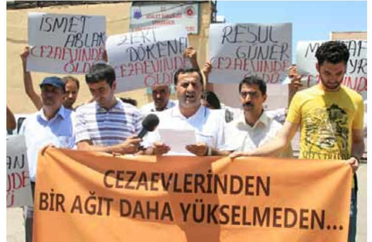
İHD Diyarbakır Şubesi - "Cezaevleri Eylemi" / 1 Temmuz 2010