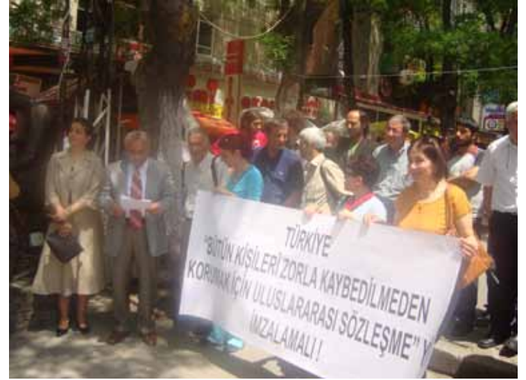
İHD Ankara Şubesi - "Kayıplar Haftası" Açıklaması / 18 Mayıs 2009