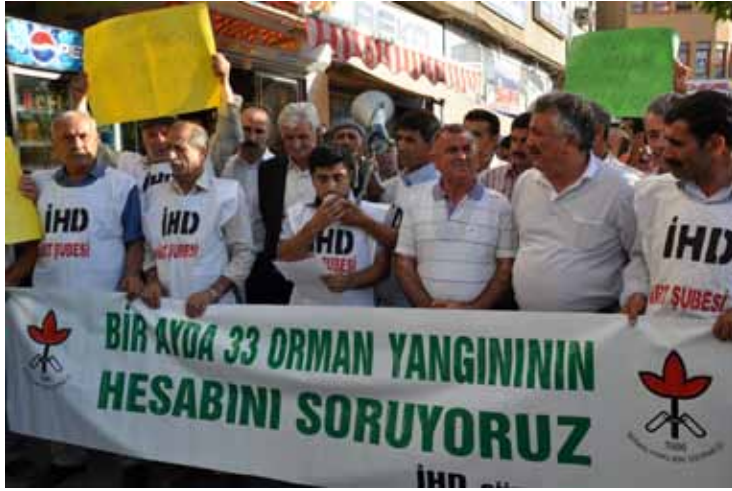
İHD Siirt Şubesi – “Orman Yangınlarına İlişkin” Basın Açıklaması 10 Ağustos 2010