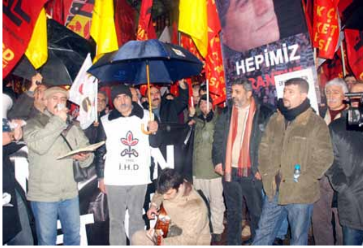
İHD Ankara Şubesi – Hrant Dink Anması / 19 Ocak 2010