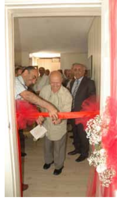
İnsan Hakları Akademisi'nin Açılışı Temmuz 2010