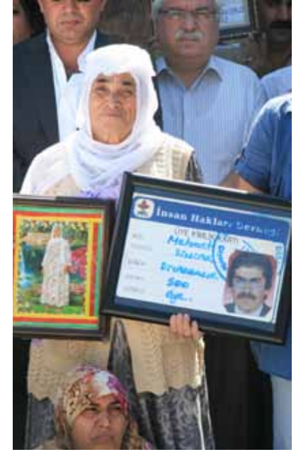
İHD Diyarbakır Şubesi – Kayıplar Eylemi 4 Eylül 2010