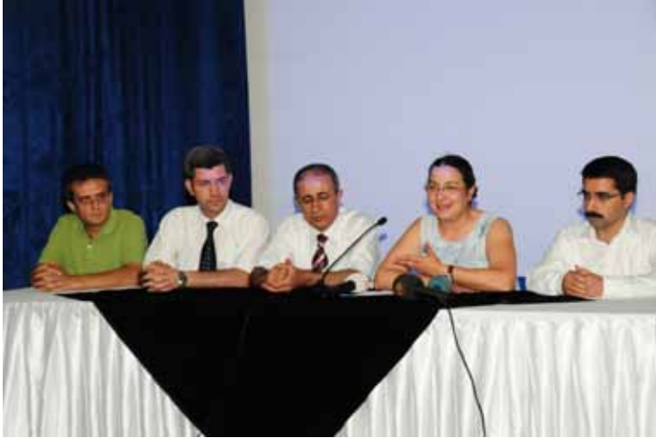
TİHV ve İHD - "İşkence Görenlerle Dayanışma Günü" Açıklaması 26 Haziran 2009