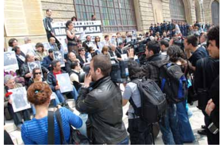
İHD İstanbul Şubesi - "Bir Daha Asla!" Eylemi / 24 Nisan 2010