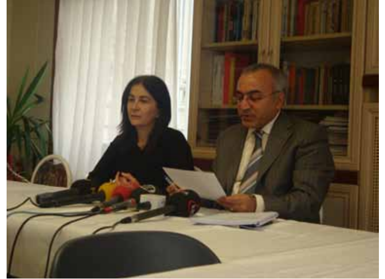
"Köy Korucuları Özel Raporu" Açıklaması / 8 Mayıs 2009