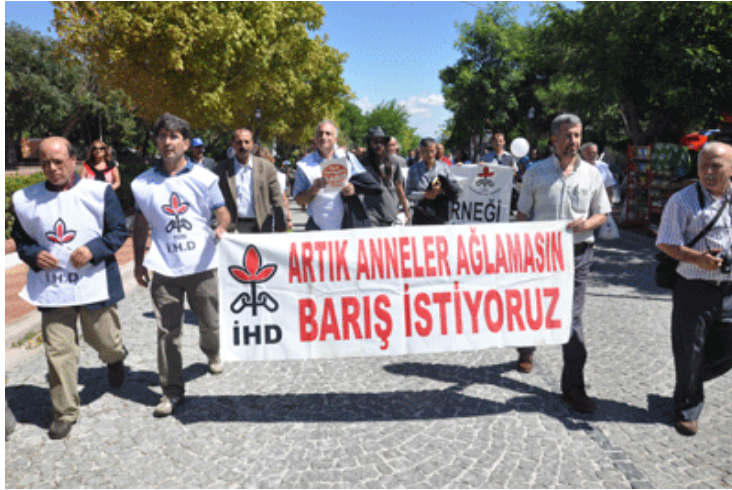
İHD Çanakkale Şubesi - “Bozcaada Barış Yolculuğu” 1 Eylül 2009