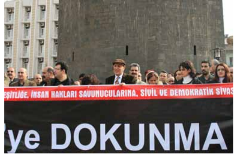
“İHD’ye Dokunma” Eylemi / 13 Şubat 2010