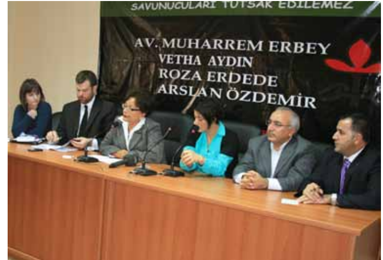
FIDH ve İHD Ortak Basın Açıklaması / 17 Ekim 2010