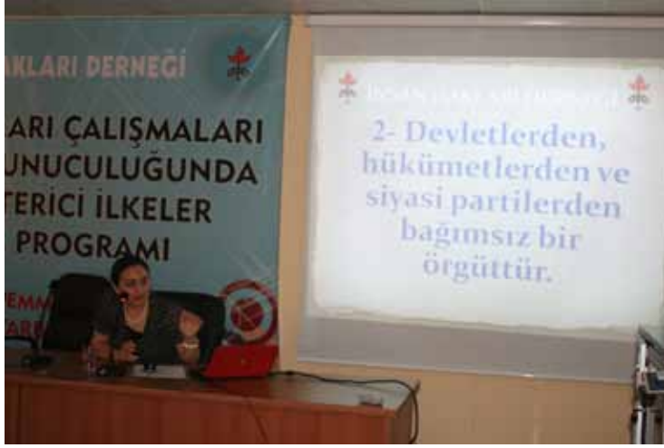
İHD Diyarbakır Şubesi – İnsan Hakları Eğitimi / 3 Temmuz 2010