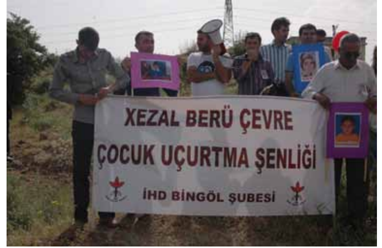
İHD Bingöl Şubesi "Uçurtma Şenliği" / 5 Haziran 2010