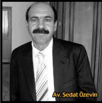
Av. Sedat Özevin