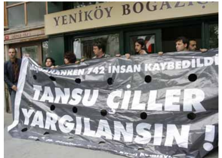
İHD İstanbul Şubesi - "Tansu Çiller Yargılsın" Eylemi 31 Mayıs 2009