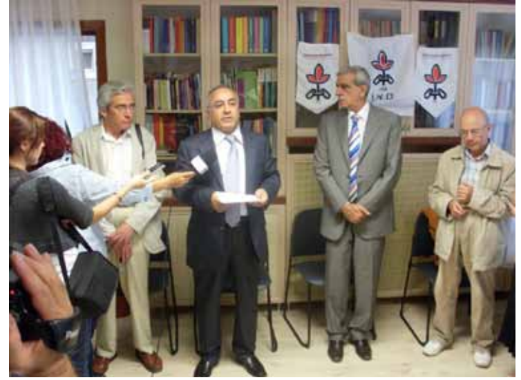
İHD 23. Kuruluş Yıldönümü Resepsiyonu / 20 Temmuz 2009