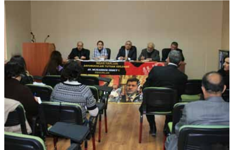
İHD MYK Toplantısı (Diyarbakır)