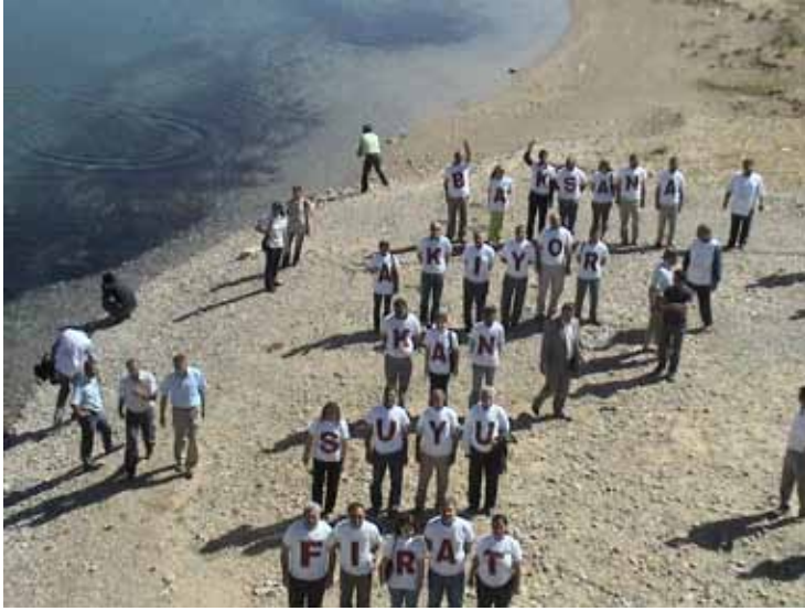
İHD Adıyaman Şubesi - "Kayıplar İçin İnsan Zinciri" Eylemi 30 Mayıs 2009