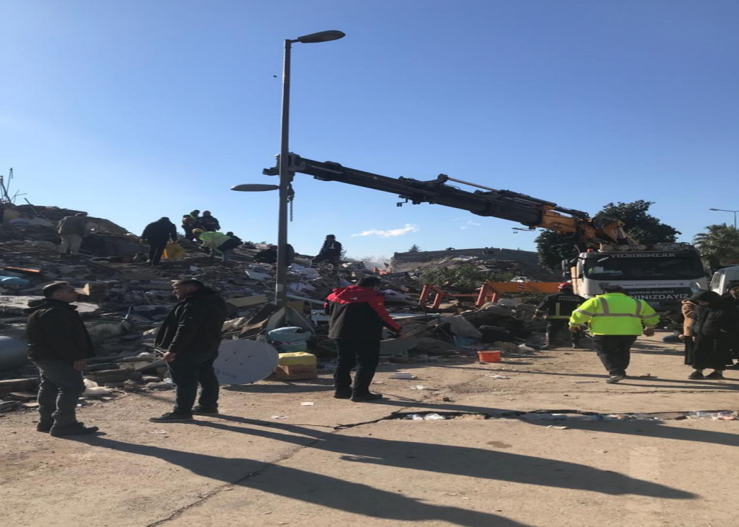
Eski (Stadyum -orman dairesi) kavşağı