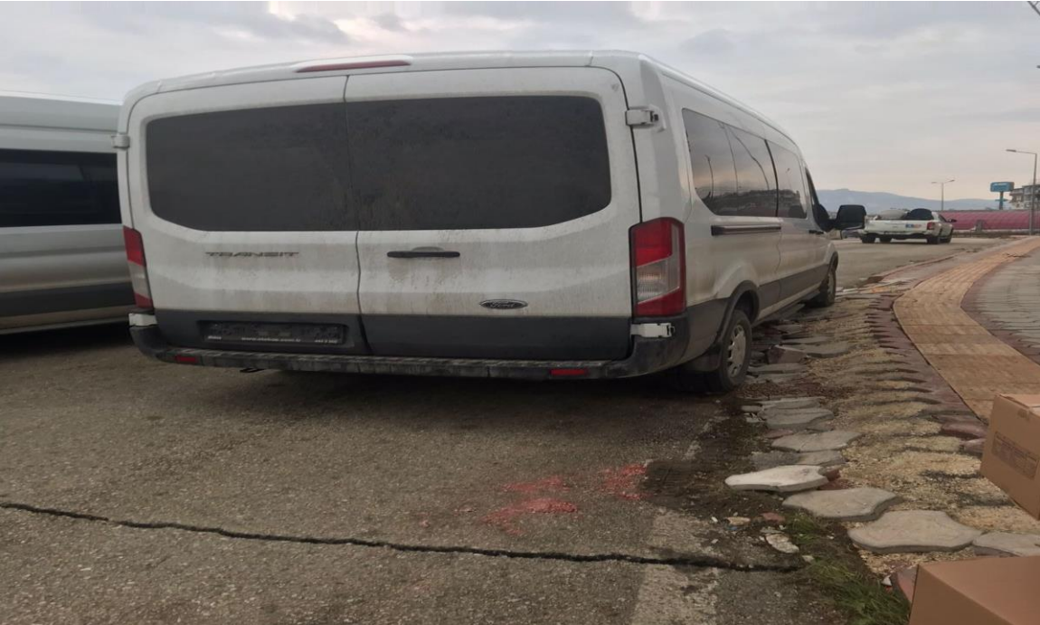
Plakasız Araçlardan Biri