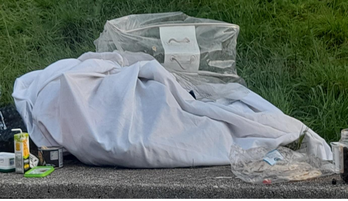
Kaldırıma Bırakılan, Brandaya Sarılan Cesetler