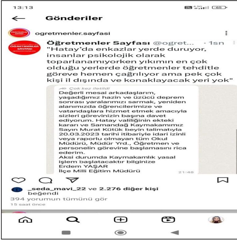
Öğretmenlere gönderilen mesajlardan biri