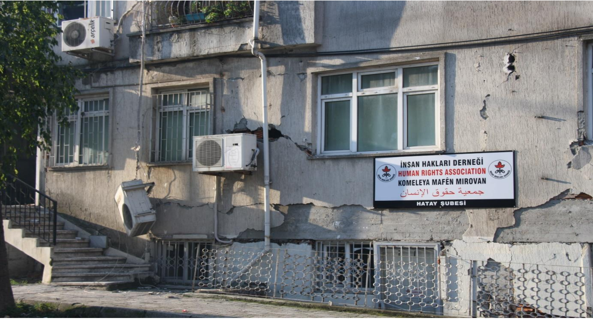
Ađır Hasarlı Dernek Binaımız