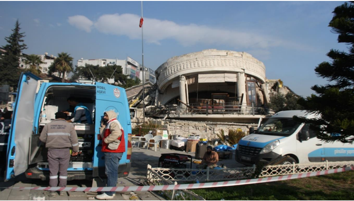
Eski Hatay Meclisi ve Kltr Merkezi