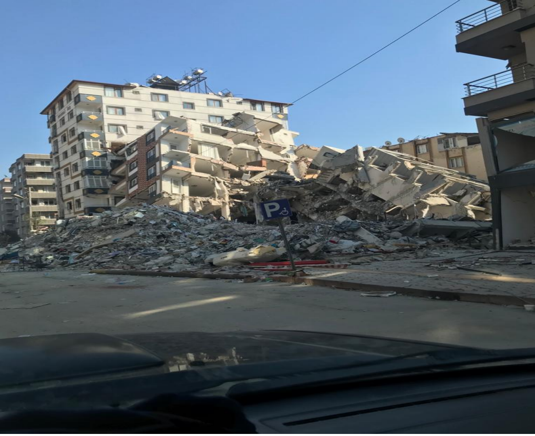
Cumhuriyet Caddesi Güçlü Bahçe