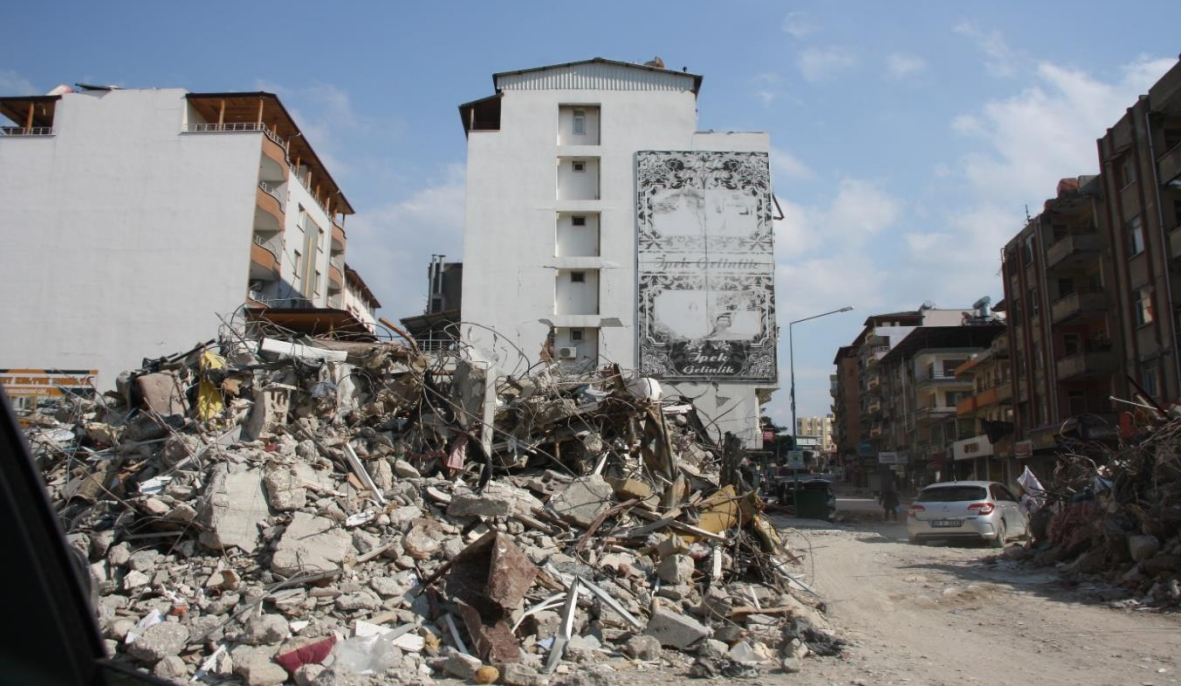
Hatay ili Samandağ İlçesi Girişi