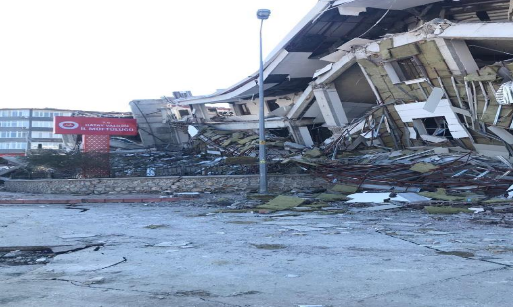
Hatay İl Müftülüğü