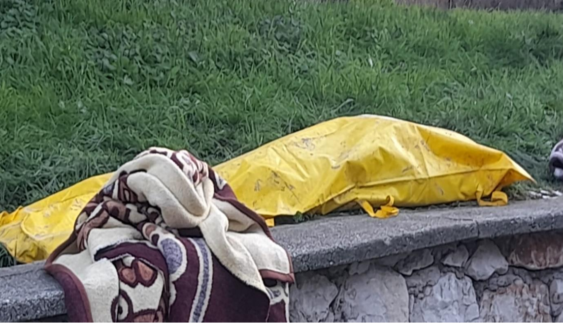
Deprem sonrası Hayrettin Özkan Ortaokulu karşısı donarak hayatını kaybeden kişinin cesedi