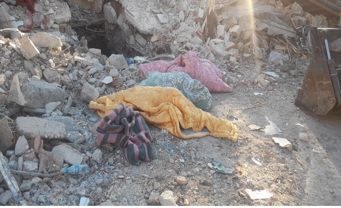
Esenlik mahallesinde bina kenarına bırakılan cesetler