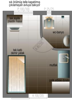
YGC Tipi Tek Kişilik Oda/Hücre